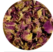
Վարդ • Роза • Rose