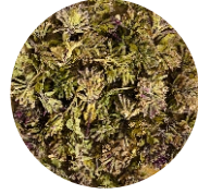
Խնկածաղիկ • Душица • Oregano