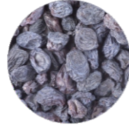
Սև Հաղարջ • Чёрная смородина • Black Currant