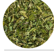
Ապուզան • Иван-чай (кипрей) • Fireweed