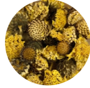
Չիվան (Դանթափա) • Цефалария (Головчатка) • Sephalaria