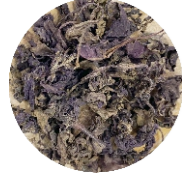
Ռեհան • Базилик • Red basil