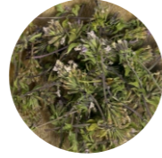
Ուրցադաղձ • Зизифора • Ziziphora