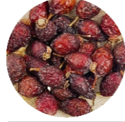
Մասուր • Шиповник • Rosehip