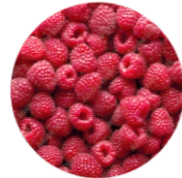
Ազնվամորի • Малина • Raspberry