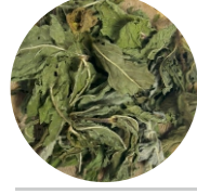
Անանուխ • Мята • Mint