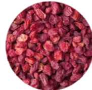
Ծորենի (Բարբարիս) • Барбарис • Barberry