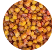
Չիչխան • Облепиха • Sea Buckthorn