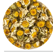
Երիցուկ • Ромашка • Chamomile