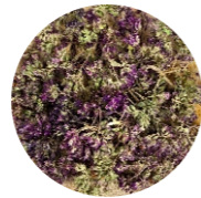
Ուրց • Тимьян • Thyme