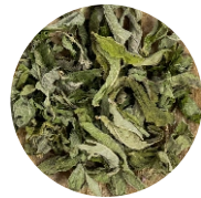
Վայրի դաղձ • Дикая мята • Wild mint (peppermint)