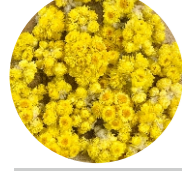
Անթառամ • Бессмертник • Everlasting flower