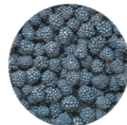
Մոշ • Ежевика • Blackberry